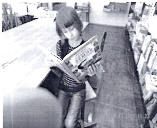
«С книгой открываю мир природы»