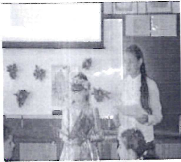
Литературная гостиная «Осень в стихах русских поэтов»