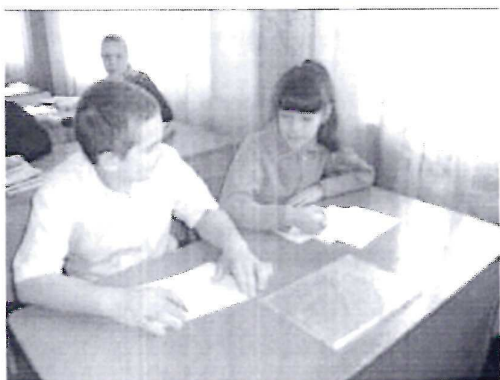
Обработка анкетирования по изучению читательских интересов одноклассников и их родителей