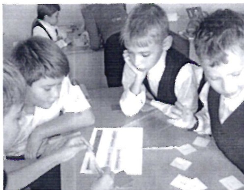
Литературные игры по страницам прочитанных книг