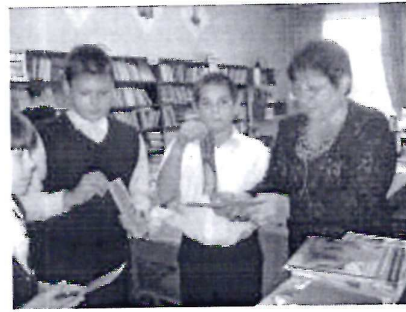
Акция для читателей школьной библиотеки «Говорящая закладка»